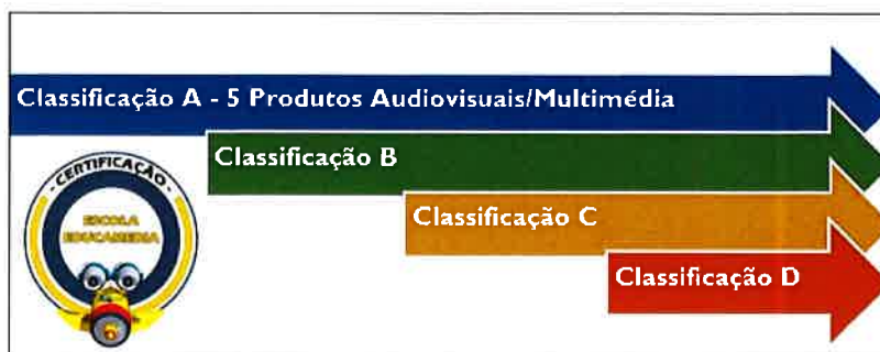
Grf. 1: Certificação “Escola Educamedia” – Classificação

A certificação é atribuída por ano letivo. Existem quatro níveis de classificação que vão de A a D, sendo que o nível A representa classificação máxima, com direito a Certificado e Selo de Excelência. As restantes categorias terão acesso a um diploma de participação com indicação da sua classificação.