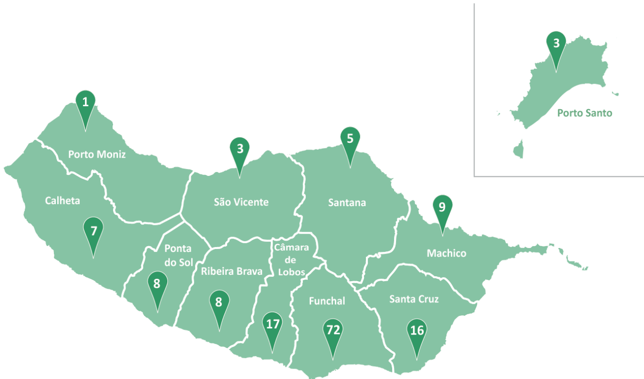
Imagem 1: Estabelecimentos de educação e ensino, por concelho