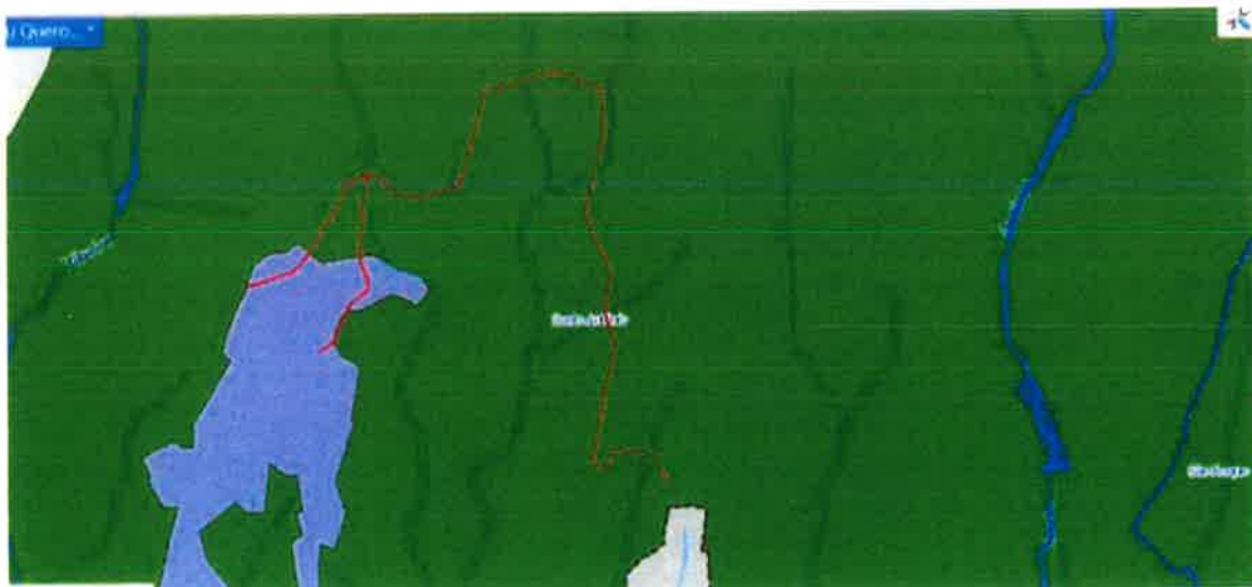
Extrato da Planta de Ordenamento I