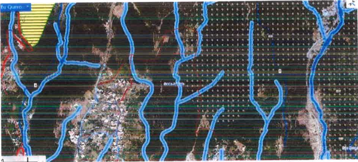
Extrato da Planta de Condicionantes

d) Em termos Servidões Administrativas e das restrições de Utilidade Pública, conforme extrato da Planta de Condicionantes, o troço em apreço é intercetado por várias linhas de água e é parcialmente abrangido por povoamentos florestais percorridos por incêndios.