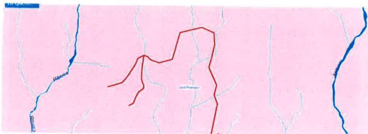
Extrato da Planta de Ordenamento III

c) Em termos de Programação e Execução, verifica-se que o troço em causa está abrangido pela Unidade Operativa de Planeamento e Gestão de Santo António - UOPG 09, (artº 91.º do RPDMF), de acordo com a planta de Ordenamento III;