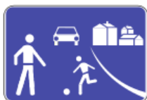
H46 - Zona residencial ou de coexistência.

*Zona concebida para utilização partilhada por peões e veículos, onde a velocidade máxima permitida é de 20 Km/h. Sinal de Zona de Coexistência: