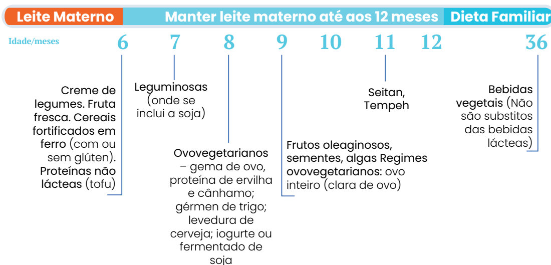
Figura 4. Proposta de diversificação alimentar para um lactente vegetariano (independentemente da existência de história positiva para atopia familiar (DGS 2019))

A partir dos 12 meses deve ser iniciada a dieta familiar, devendo adotar-se alimentos frescos, evitando os mais processados, e as refeições devem ser frequentes, em intervalos máximos de 3 horas, de forma a garantir uma ingestão adequada de energia (3,4,37). A ingestão de gordura não deve ser limitada, pelo que os óleos e os cremes vegetais podem ser incluídos de forma a garantir um aporte correspondente a 35% do valor energético total (29).