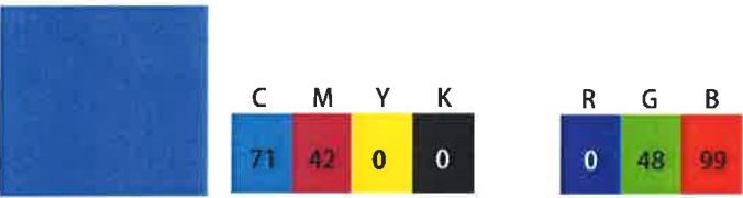
Pantone 2727 C